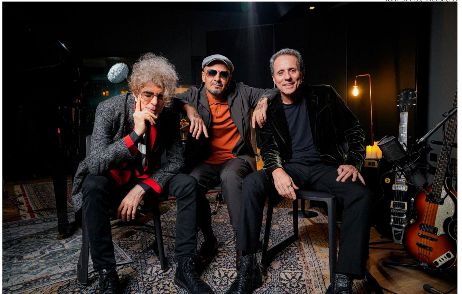
Titãs confirma por que são citados como dádivas da música popular brasileira: novo trabalho mostra banda intimista

"Microfonado" ulula na caixa de som. Titãs, cara, é dádiva irrefutável de nossa música! Enquanto escrevo, penso que poucas bandas na história acenam tão bem para o futuro quanto os paulistanos - agora reduzi-