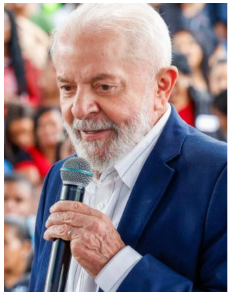
Lula da Silva: dificuldades em reduzir gastos públicos

"Começamos aqui a discutir 2025, a agenda de gastos. O que a gente pediu foi uma intensificação dos trabalhos", afirmou Haddad há pouco mais de três semanas. "Nós temos um dever de casa agora sobre o lado das despesas.