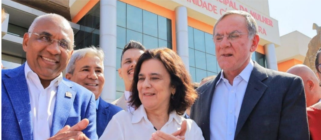
Solenidade que anuncia requalificação do Hospital Municipal da Mulher e Maternidade Célia Câmara

A gestão do HMMCC, realizada por convênio tripartite