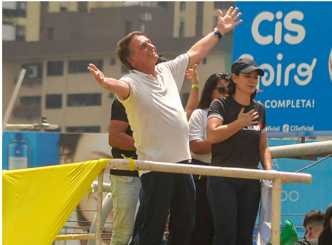
Jair Bolsonaro: oposição volta ao poder no Brasil em 2026

Condenado pelo TSE e tornado inelegível em dois processos, por mentiras e ataques ao sistema eleitoral e por abuso de poder e campanha com dinheiro público nas comemorações do Dia da Independência, Bol-