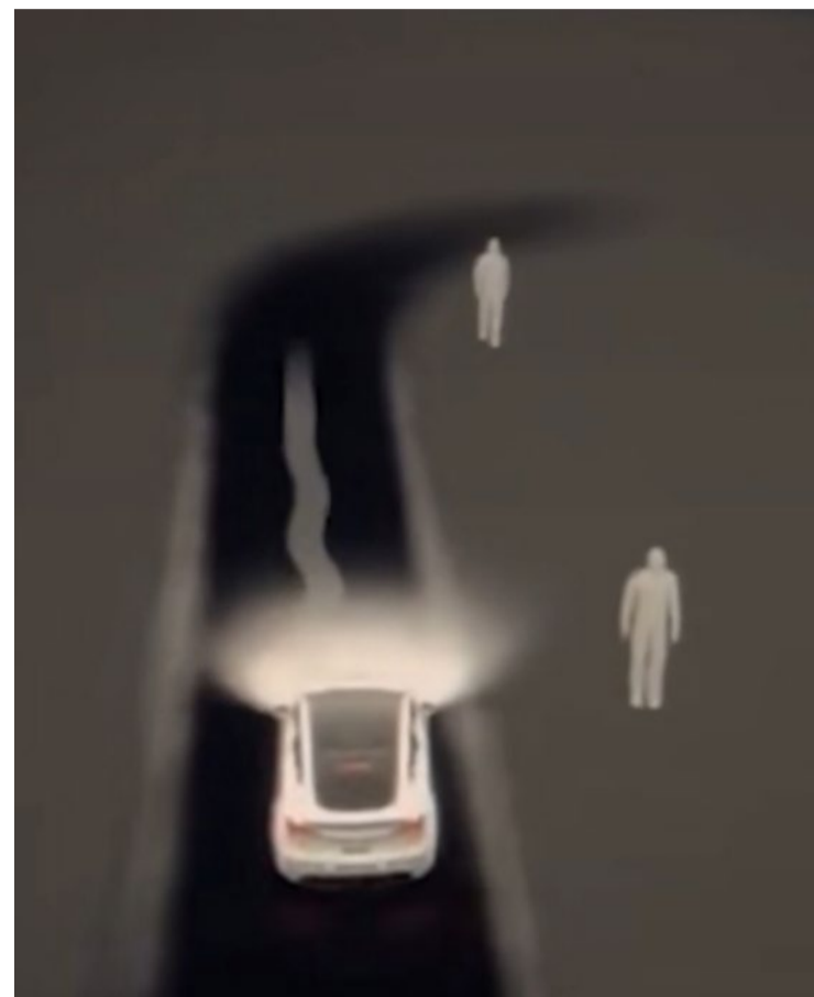
Imagem mostra tela do Tesla capturando imagens de ‘gente’ lá fora, mas na cena real ninguém está próximo

Fato ou ficção, relatos tornaram-se comuns no Tik Tok. Sensor anticollisão do carro aponta presença de ‘fantasmas’