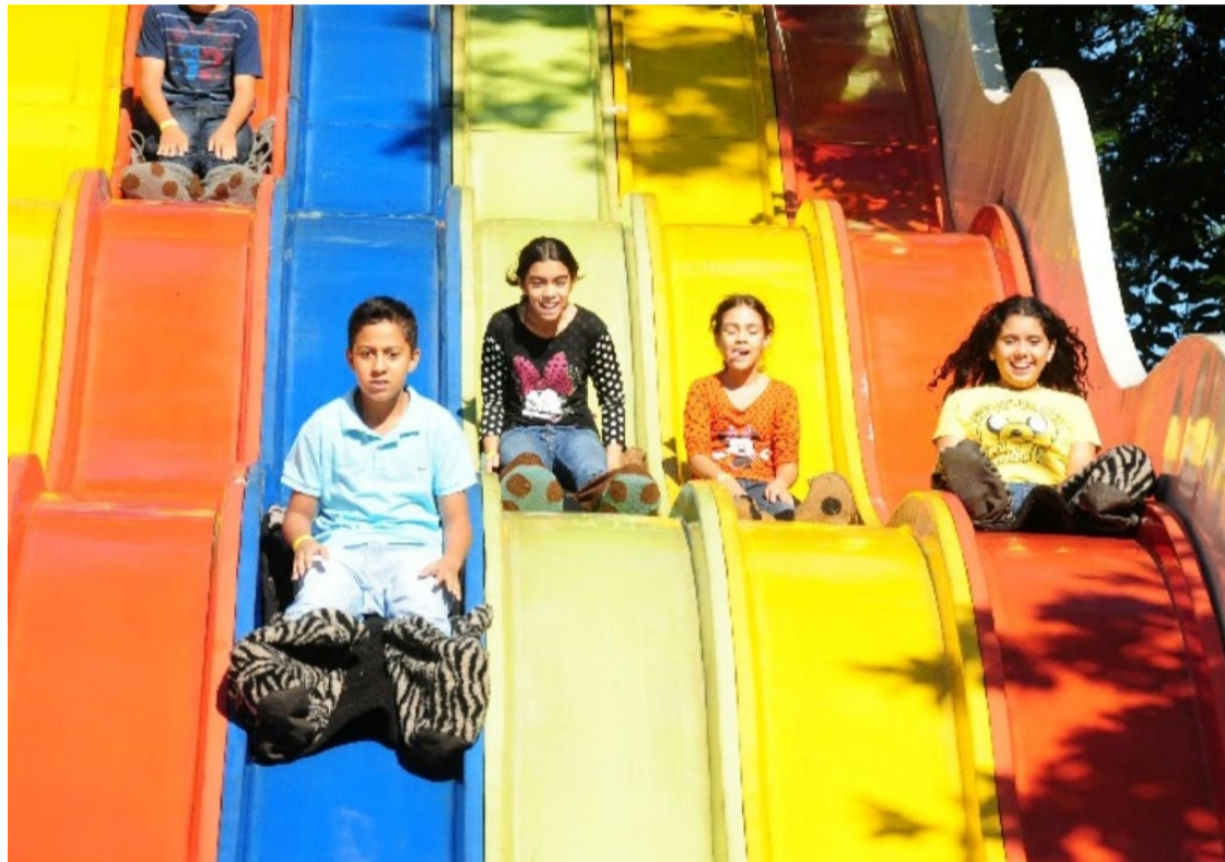
Crianças se divertem no parque Mutirama: uma das melhores alternativas de férias na Capital

Julho é sinônimo de criança em casa e cheia de energia. DM traz roteiro com opções da Capital e também como se divertir em casa