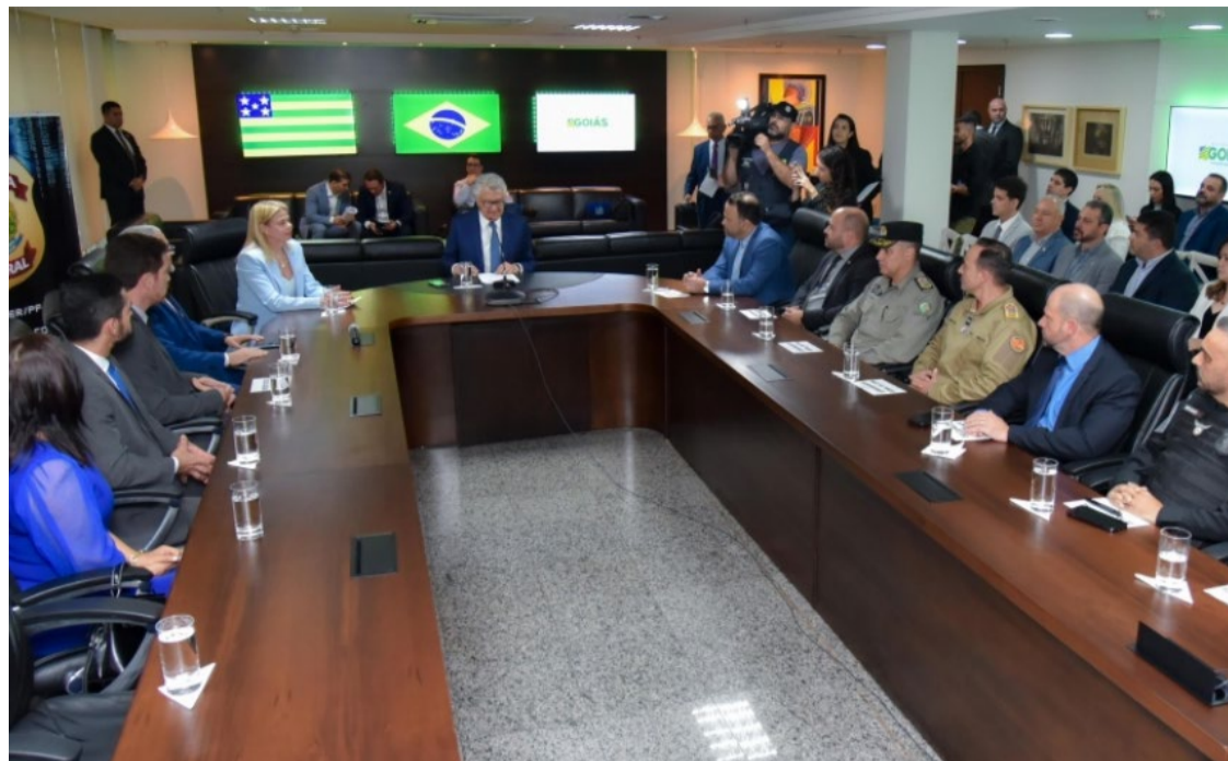
Ronaldo Caiado assina acordo com PF para troca de informações: foco no combate à lavagem de dinheiro e pedofilia