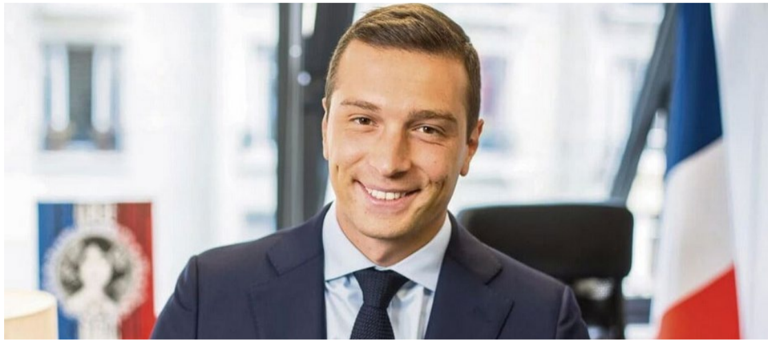
Jordan Bardella, 28, despoja como jovem líder da extrema-direita francesa

A vitória potencial do RN nas eleições legislativas france-